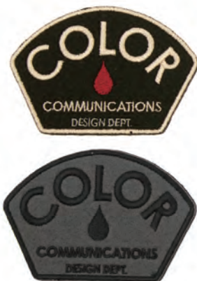
DESIGN DEPT. COLOR : BEIGE/BLACK : BLACK/GREY SIZE : FREE (5.5cm x 8cm) PRICE : ¥1,100 plus tax