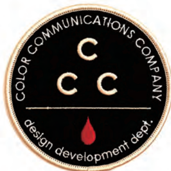
CCC LG COLOR : GREY/WHITE : BEIGE/BLACK SIZE : FREE (10cm x 10cm) PRICE : ¥900 plus tax