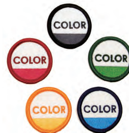
CIRCLE INK COLOR : BLACK : RED : GREEN : YELLOW : BLUE SIZE : FREE (4.3cm x 4.3cm) PRICE : ¥400 plus tax