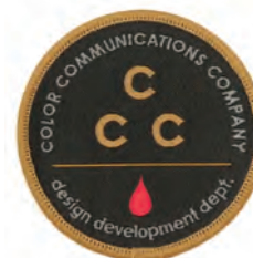
CCC COLOR : GREY/WHITE : BEIGE/BLACK SIZE : FREE (6.5cm x 6.5cm) PRICE : ¥600 plus tax