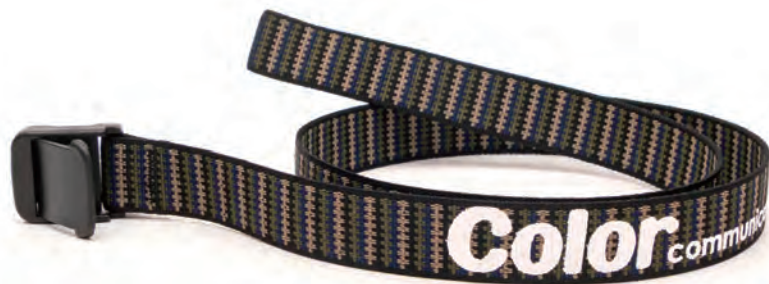
ZIG ZAG BLACK