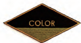
DIAMOND COLOR : BEIGE/BLACK SIZE : FREE (3.5cm x 7cm) PRICE : ¥1,100 plus tax

>DIAMOND / DESIGN DEPT. / CCC LG / CCC / CIRCLE INK